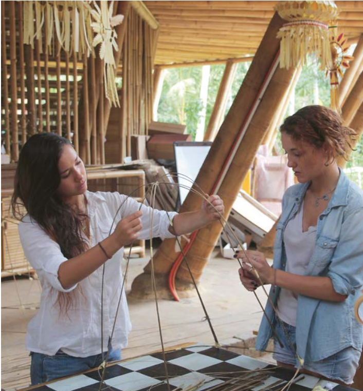
⤴ Kunst og håndverk er også del av skolehverdagen.