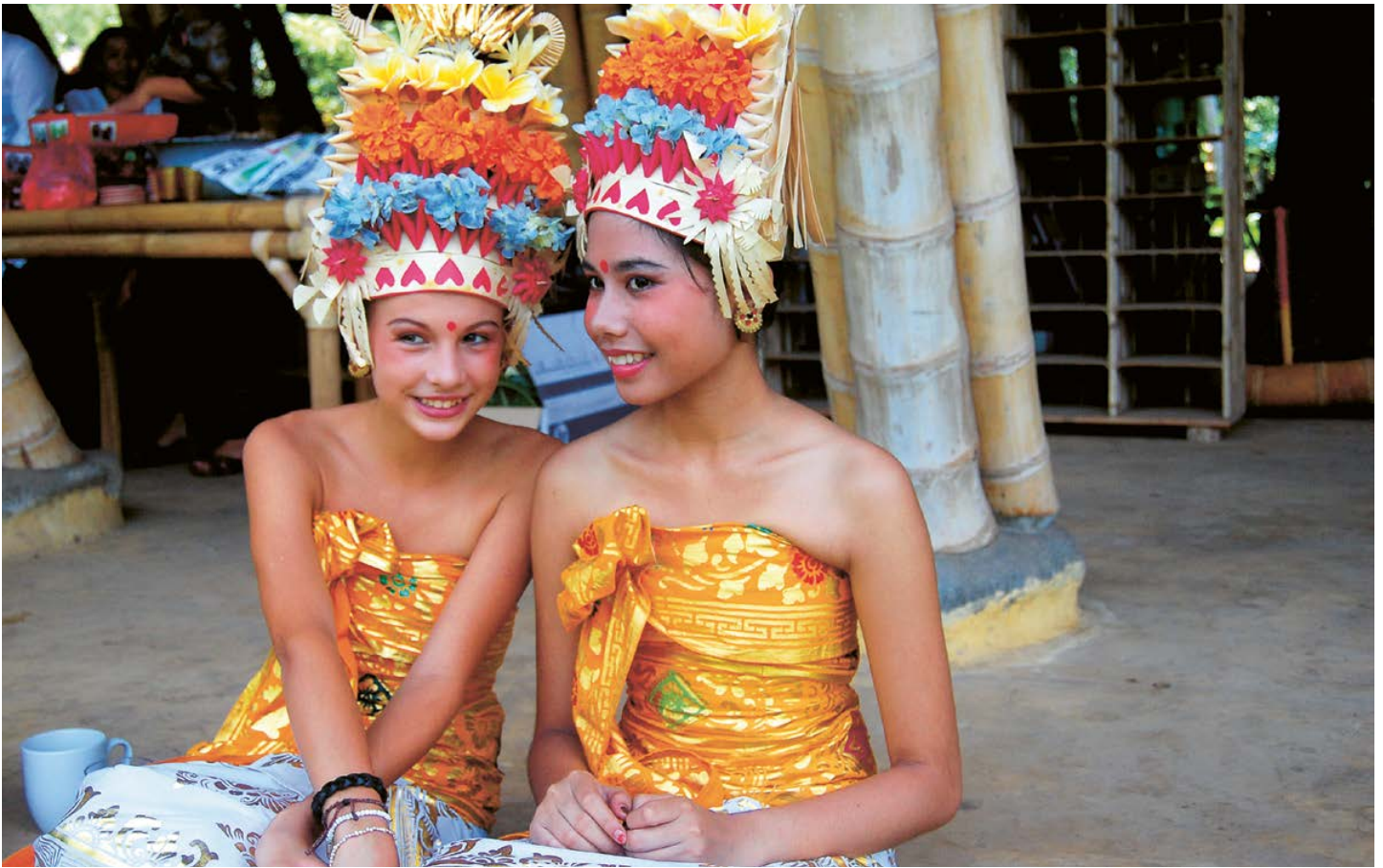
⤴ Green School er en flerkulturell skole. Balinesisk kultur er en selvsagt del av skolehverdagen. Disse jentene er kledd i tradisjonelle drakter.

De forteller at det vil bruke media, presentere temaet ved besøk på andre skoler og få folk til å skrive under på underskriftskampanjer.