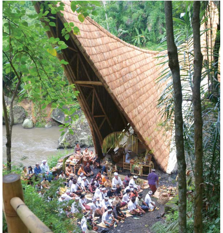
⤴ Elevene får være med på en seremoni nede ved elven.