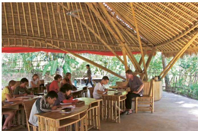
⌘ Over: Barna lærer å bygge økologisk, med lokale materialer. ⌘ Under: Noan Fesnoux er lærer ved skolen.