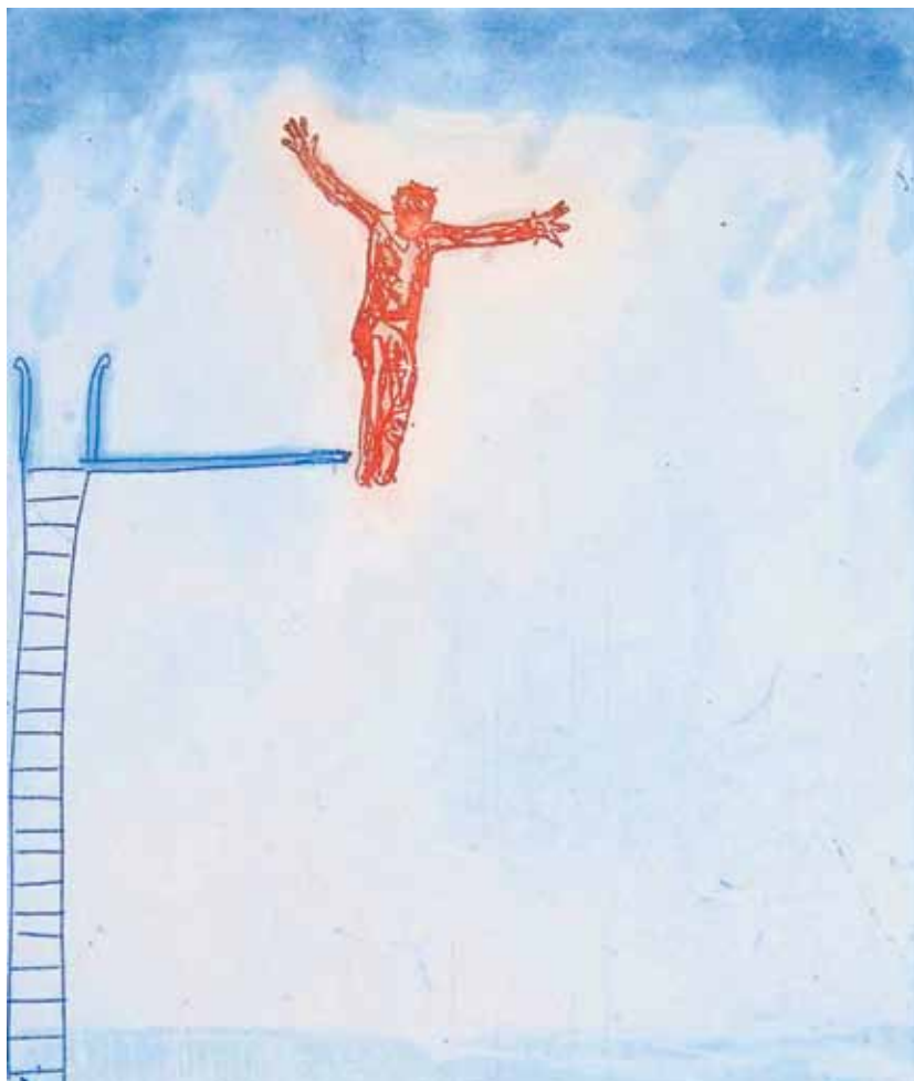
Kunst-trykk av Bjørg Thorhallsdottir.

«Sorg og smerte etter et dødsfall kan være veldig vakkert, ikke bare vondt.»